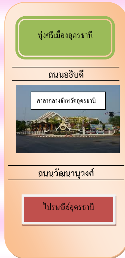
แผนที่ สำนักงานพระพุทธศาสนาจังหวัด อุดรธานี